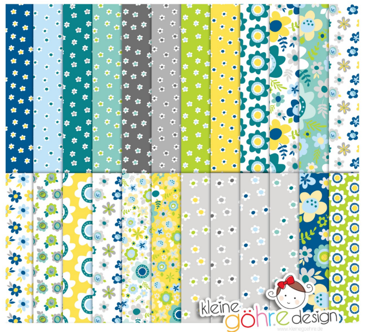
digitale Papiere "Sprüche planlos Blüten"