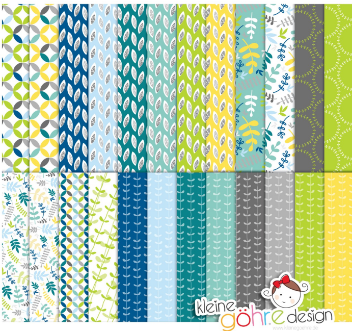
digitale Papiere "Sprüche planlos Blätter"