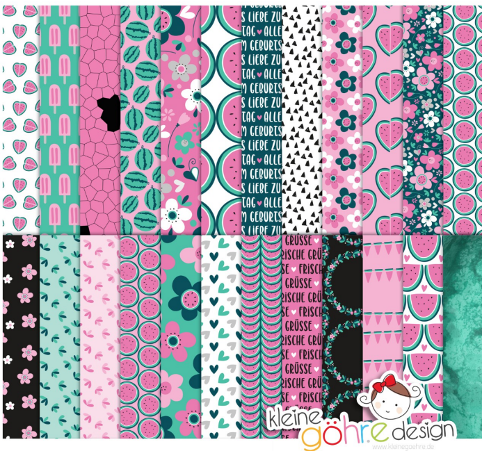
digitale Papiere "Melonenmal Muster1"