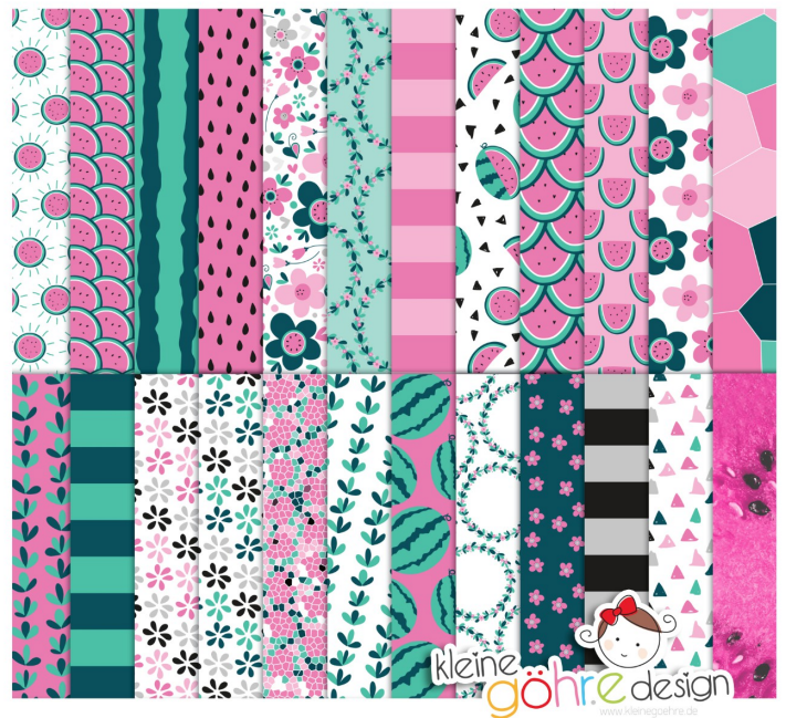
digitale Papiere "Melonenmal Muster2"