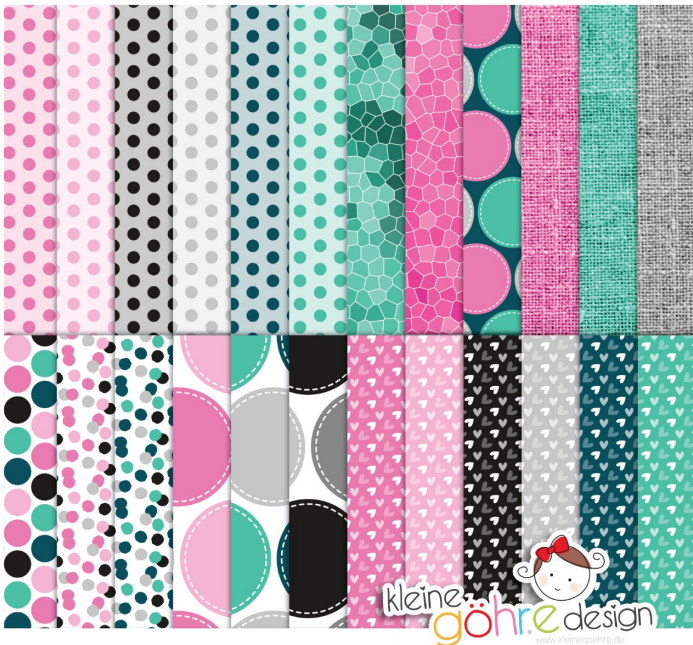
digitale Papiere "Melonenmal Punkte&Co"